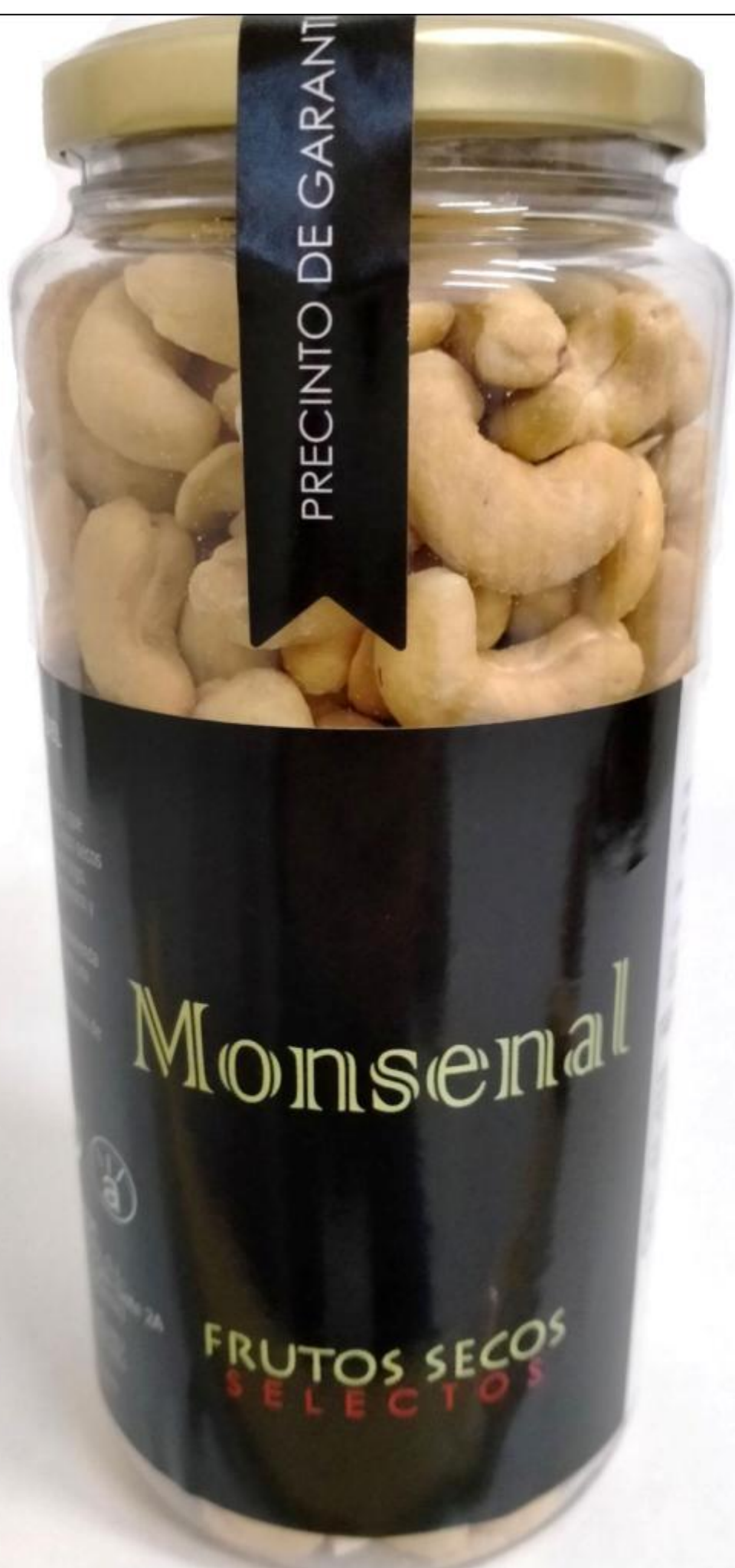
ROASTED CASHEW - 400G